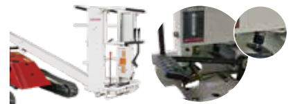
ブーム上昇時、自動でエンジン回転を 低減。走行速度制御機構。

エンジンカバーは工具いらずでフルオープン、 日常の点検・シーズンオフの整備が可能。 昇降シリンダロック機構で整備時も安心。