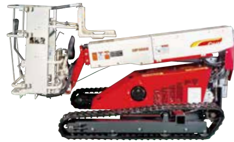
全長はクラス最短 2,475mm

作業範囲は上下3.4m・左右3.5m。伸縮式ブームで 下枝をかわず作業もスムーズに。ブームを縮めるとコンパクトに収納。